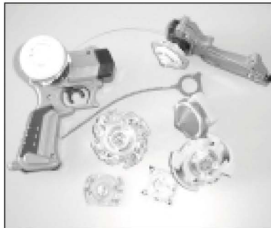
Les Bayblade, l'evolució més moderna de les tradicionals baldufes.

Les màquines recreatives eren enormes aparells, coneguts també com arcades, que podíem trobar en bars i salons especialitzats. No és estrany que aquestes màquines fossin la primera aproximació del públic adolescent cap als bars tradicionals (i no tradicionals) de la vila. Llocs com el Quim's o la Sala Saturn reunien desenes d'adoles-