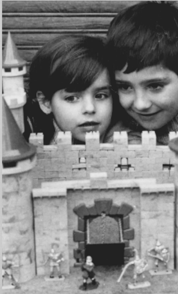
Joc i joguina a Cassà (1920-2000) Per GREC (Grup de Recerca d'Estudis Cassanencs)