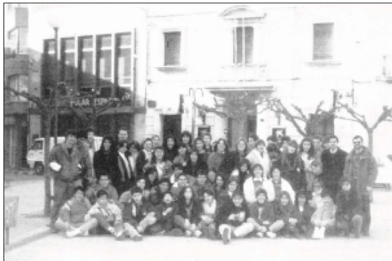
Els alumnes i els professors poc abans d'acomiar el primer trimestre del curs 1988-1989. (Llumiguia, núm. 448, gener 1989).