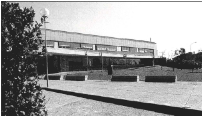
Imatge exterior de l'edifici de l'IES actual.

E l fet de poder disposar d'un Institut d'Educació Secundària en un poble com Cassà de la Selva va ser una fita important, tant per als cassanencs com per a tota la zona d'influència. Cal pensar que aquest centre té escolaritzats uns 500 alumnes i que hi treballen més de 60 persones. Això implica una relació, al llarg d'aquests 15 anys d'existència de l'Institut, amb uns dos milers de famílies.