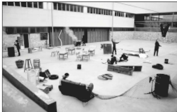
Escenificació de la vida diària d'uns estudiants bosnis, feta a l'IES. (IES)