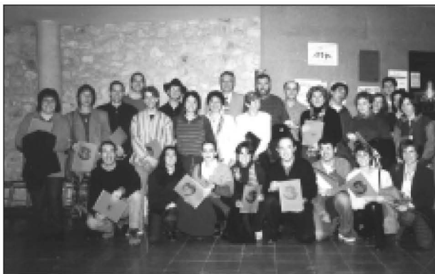
Grup de col·laboradors del projecte Solidaritat amb Bòsnia. (IES)

L'objectiu final d'aquesta campanya era recollir un milió de pessetes per a la reconstrucció de l'Institut bosnià. Aquesta quantitat va ser superada amb escreix. Amb la recaptació d'una festa que es va fer a la discoteca Basik de Cassà de la Selva es va pagar el llibre editat per l'APA, que recollia les diferents conferències dutes a terme a les quatre primeres edicions de les Jornades per a Pares. Així, la totalitat del benefici que es va treure de la venda del llibre Ser adolescent , quina moguda! es destinà al fons que va permetre