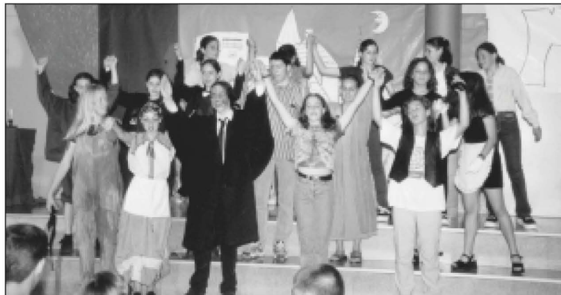
Representació dels alumnes que participaven a l'activitat extraescolar de teatre. (IES)