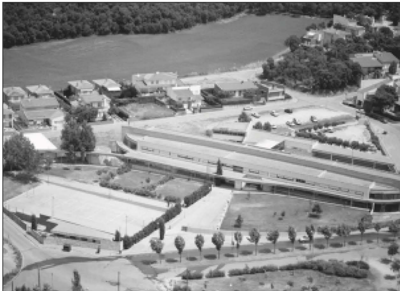
Vista aèria de l'IES

nistració, bar, magatzem i serveis. La planta superior, a la qual s'accedeix per una rampa central i per dues escales situades a cada extrem de l'edifici, compta amb vint-i-una aules de diferent capacitat i tres seminaris. L'edifici annex es distribueix entre la sala de professors, la biblioteca, l'aula de música i 2 despatxos més.