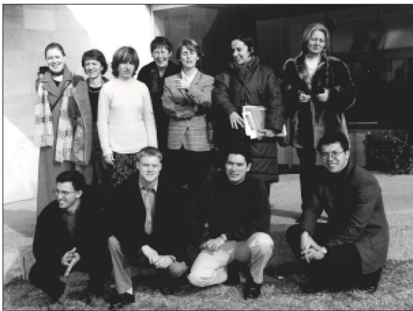
Equip de treball del projecte Comenius. (IES)

El 19 de maig es va realitzar una marató matemàtica en la qual tots els alumnes de l'IES van passar una bona estona resolent problemes tot fent ús de la seva creativitat i del seu bon sentit de l'humor. D'altra banda, es va aprofitar aquest acte, organitzat pel Departament de Matemàtiques, per manifestar la nostra solidaritat amb els que tenen menys que nosaltres. Gràcies a les aportacions voluntàries dels alumnes, l'IES de Cassà de la Selva va poder apadrinar un nen i una nena del Tercer Món.