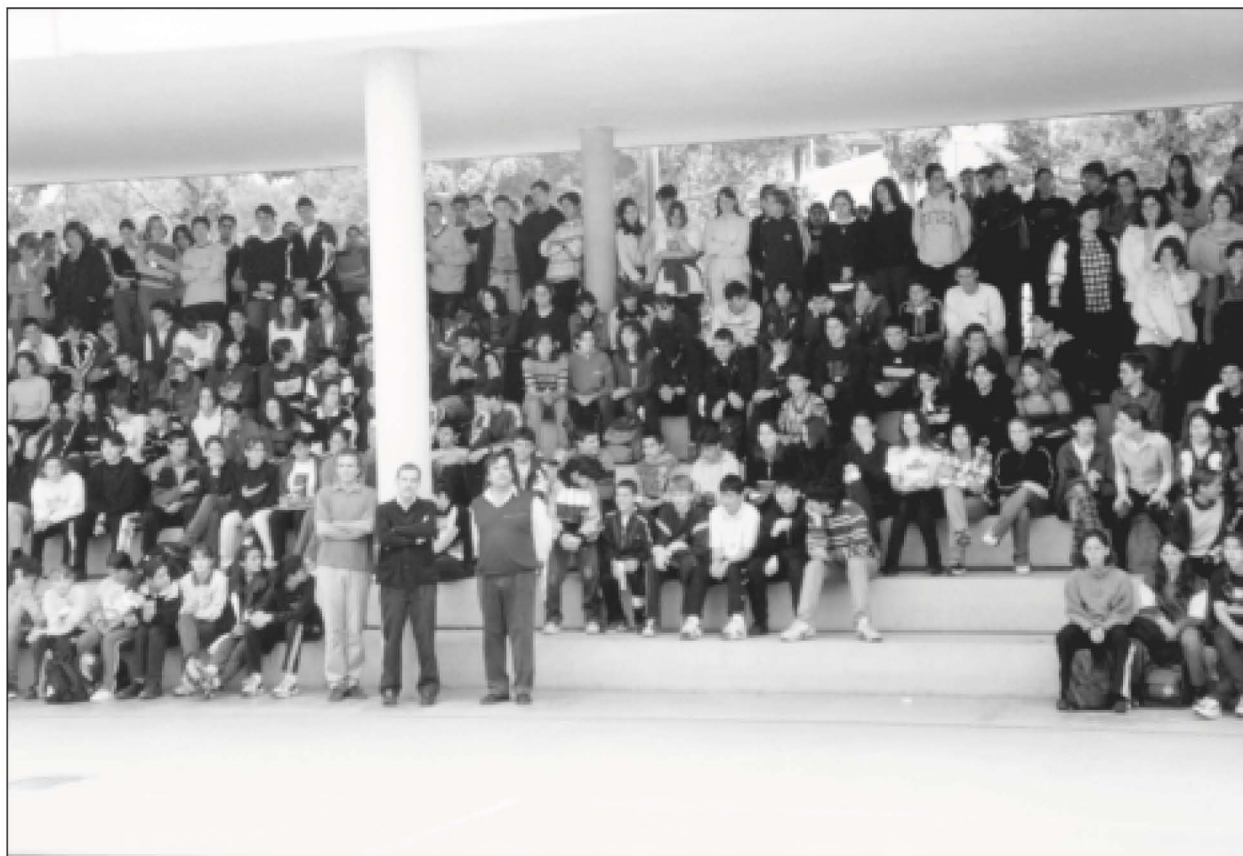
Una part de l'alumnat i del professorat de l'IES. (IES)

Aquest curs es va poder accedir per primera vegada a la pàgina web de l'IES de Cassà de la Selva.