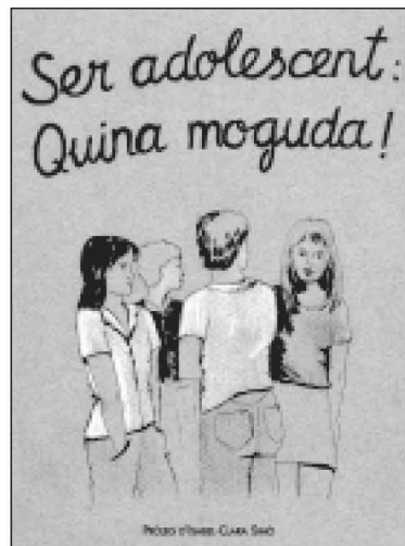
Portades de dos llibres editats per l'IES.

ció entre els pares per parlar de tots els temes que els afectessin i obrir un nou espai de reflexió. La nova publicació era titulada Zum-Zum, una onomatopeia que el diccionari defineix com una "remor sorda i continuada". Aquest primer