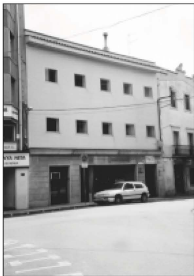
El primer curs es va iniciar l'any 1988 a la casa de cultura Manuel de Tolosa.

Durant el curs es va veure la necessitat de disposar d'una aula d'informàtica, per la qual cosa l'Ajuntament va cedir un local a can Vall-Ilovera, a la mateixa plaça de la Coma. Cal esmentar que des d'aquest primer any d'Institut fins a la construc-