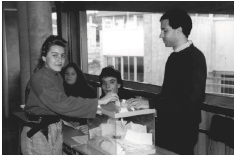
Una alumna dipositant el seu vot en les eleccions del Consell Escolar. (IES)

El dissabte dia 8 de maig de 1993 es va celebrar a l'IES de Cassà de la Selva amb el títol: Família i Adolescència, les Primeres Jornades per a Pares i Mares a les comarques de Girona, organitzades per l'APA de l'IES en col·laboració amb el centre i