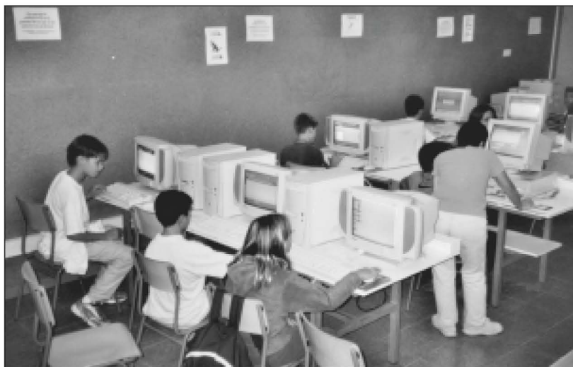
Interior de l'aula d'informàtica. (IES)

Amb aquest projecte es pretén aconseguir fonamentalment dos objectius: d'una banda mostrar als alumnes i a la societat que és viable una alternativa moderna i ecològica d'obtenció d'energia, i d'altra banda aprofundir en el coneixement i l'estudi de l'energia solar. Sobre aquest darrer aspecte cal afegir que el projecte preveu la connexió de la central a un sistema informàtic que ha de permetre l'obtenció de dades i el seu posterior estudi per part dels alumnes.