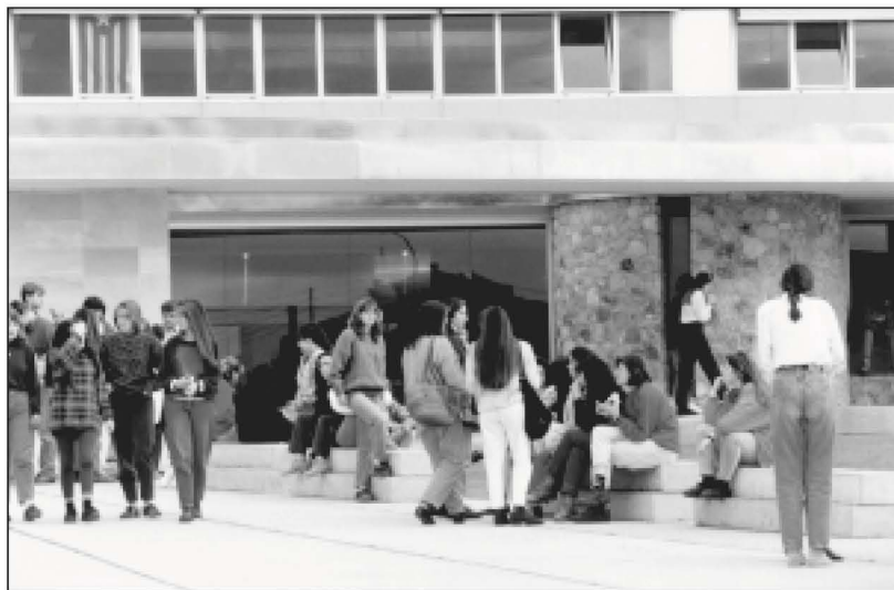
Alumnes a l'entrada de l'IES. (IES)

La novetat més destacada del començament del curs 1995-96 va