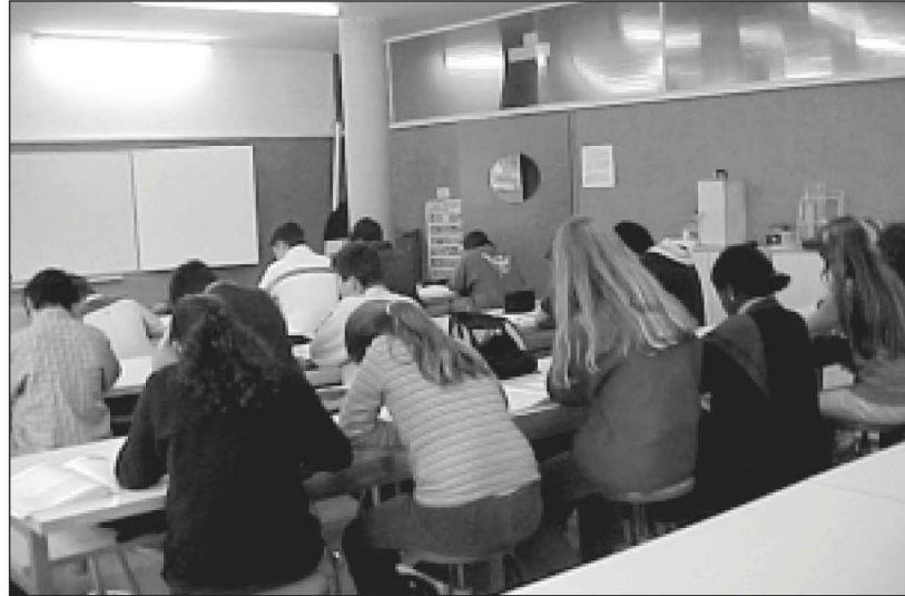
Imatges de la rampa i l'aula de biologia a l'interior del nou edifici de l'IES de Cassà de la Selva (IES).

bàsicament a l'exterior. El termini oficial de lliurament de l'obra finalitzava al final de febrer, però l'empresa constructora havia demanat una pròrroga de tres mesos. Aquest retard es devia als problemes que van sorgir durant la fonamentació i a un replantejament que va obligar a fer de l'estructura de l'edifici.