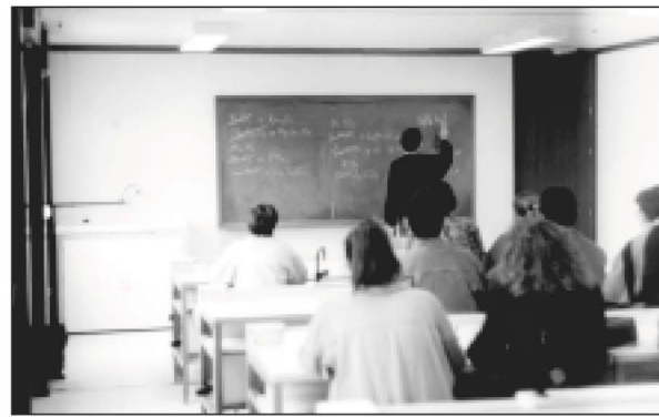
A l'esquerra els mòduls prefabricats que es varen instal·lar a la plaça Xesco Boix, l'any 1990. (IES) A la dreta, interior d'un dels mòduls. (IES)