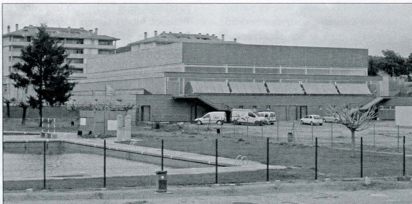
El pavelló triple que es va inaugurar el 2011