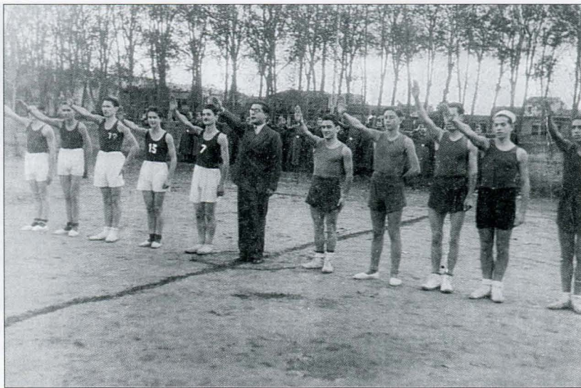
L'equip Frente de Juventudes de Cassà de la Selva i Educación y Descanso de Girona, a la devesa gironina, l'any 1944, cantant el Cara al Sol , abans de començar el partit, com era obligatori a l'època.

A Girona s'organitza un campionat propi, la Copa Girona, que funcionarà, en principi, al marge de les competicions federatives. Aquets torneig i la seva no-relació amb les competicions federatives són la constatació d'uns problemes persistents: la falta de voluntat per part dels equips de Barcelona d'acceptar equips que estiguin tan lluny, els problemes econòmics i la falta de mitjans de transport adequats. Aquesta competició significa la confirmació de la pràctica en algunes poblacions i el naixement d'altres equips. En efecte, en la I Copa Girona Trofeo Señor Gobernador Civil, s'hi troba la participació dels equips següents: AD Farners, AD Blanes, ED GEiEG, ED Figueres, Baloncesto Palau Sacosta, i JACE de Banyoles. Destaquem que força localitats importants de la província de Girona hi tenen representació, totes lligades a Educación y Descanso, excepte la de Banyoles, que està formada per grups de joves d'Acció Catòlica. Notem la importància de la presència del Palau Sacosta que, sota la figura de Joaquim Canals, forma un equip que es coneix també com l'equip dels Químics, perquè està lligat a la fàbrica existent a la població en el pati de la qual jugaven els