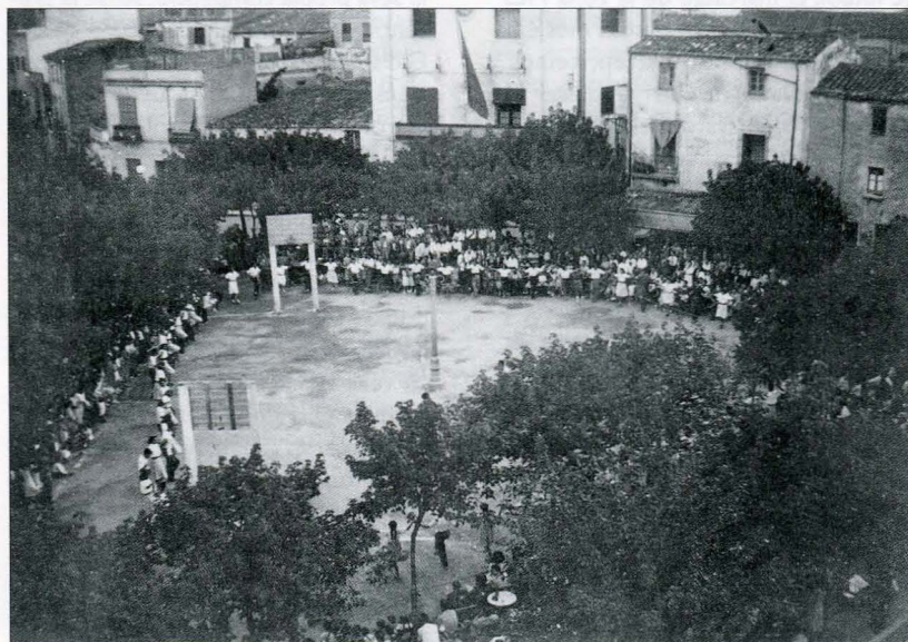
A la plaça de la Coma, les cistelles de bàsquet, posades en dies especials, havien de compartir l'espai amb els sardanistes, en els anys quaranta