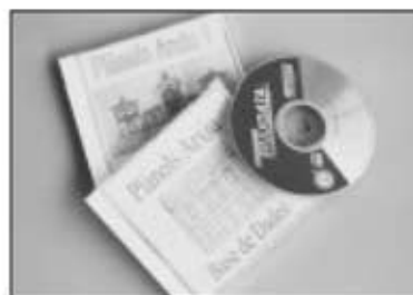
Hi ha 600 plànols digitalitzats que corresponen als anys 1860-1935.