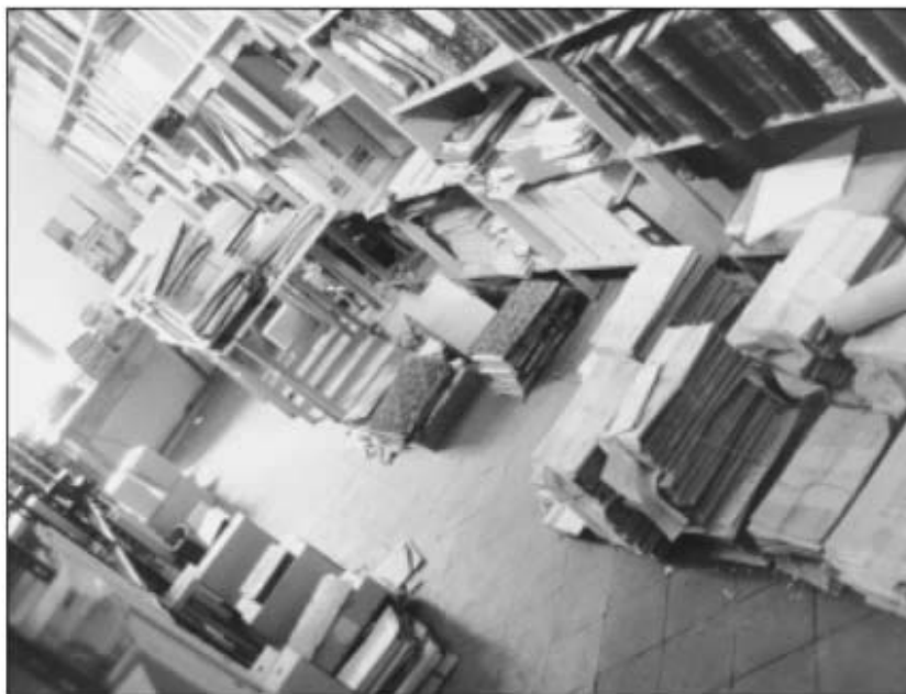
Estat de l'Arxiu Històric a la plaça de la Coma fa deu anys.

Com es pot comprovar les dades sobre les diferents ubicacions del consistori municipal són difuses, poc concretes, però el que és segur és que l'exterior del temple i el mateix temple parroquial varen ser durant segles la seu dels consells municipals