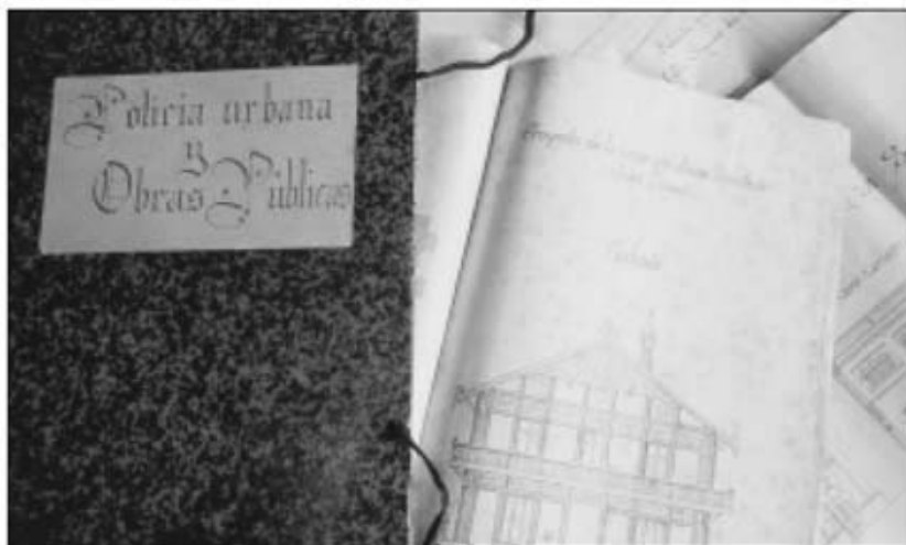
Lligall amb documentació que feia referència a la Policia Urbana i Rural.

El servei d'Arxiu està obert al públic de dimarts a divendres, de 9 del matí a 2 del migdia, i una tarda a convenir amb l'usuari. També es poden fer consultes a través d'un