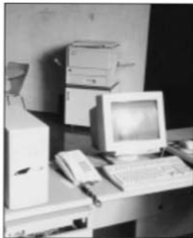
Sala de consulta del servei de l'AMCS.

De totes maneres l'augment de la documentació generada pel mateix