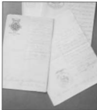
Correspondència que varen enviar diferents societats cassanenques a l'Ajuntament de Cassà de la Selva.

pondència dels anys 1891 al 1893, reglament de l'any 1891, llibre d'actes 1891-1900, llibre de caixa 1891-1900, llibre de registre de socis 1891-1900.