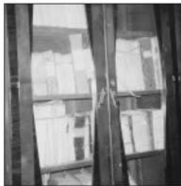
Documentació del Jutjat de Pau a la Cora.

Correspondència, certificats de matrimoni, expedients de matrimoni, defuncions, inscripcions de naixement.