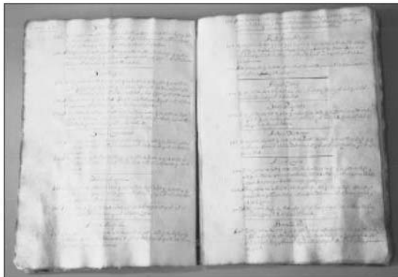
Cadastre de l'any 1733.

L'apartat d'Hisenda és també un dels més voluminosos, com ja hem dit anteriorment, i un dels més importants per dues raons: perquè el funcionament de l'Administració local va molt lligat amb la gestió dels seus recursos econòmics i perquè hi ha el cadastre de l'any 1733; que és el llibre més antic que es conserva dels realitzats per l'Ajuntament. De fet una de la documentació més interessant és la que es localitza en els impostos municipals i estatals atès que el control dels municipis sobre els béns i les activitats dels vilatans per tal de percebre ingressos donen una visió de primer ordre de l'estructura social, econòmica,