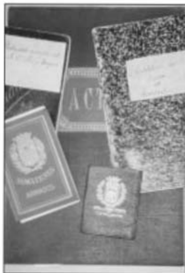
Peces del fons del Sometent.

de Cassà de la Selva 1920-1928. Quadern de llistes nominals de caporals, subcaporals i individus, armament, altes i baixes 1914-1933. Llistes generals de personal i armament 1920-1930 (aprox). Cens de personal i armament, altes i baixes 1933. Llibres de caixa del Sometent Armat 1927-1932 i 1932-1951. Llibreta de comptes de Secretaria del Sometent Armat 1920-1932. Llibreta de subscriptors al B.O. "Paz y Tregua" 1932-1933. Llicències d'ús d'arma llarga i curta, amb les guies corresponents 1932, 1934. Carnet d'instruccions personals en cas de toc a sometent 1930 (aprox.). Instruccions a caporals de partit i municipi 1934. Reglament d'ordre intern de la Junta Local. Correspondència diversa 1932 i 1934.