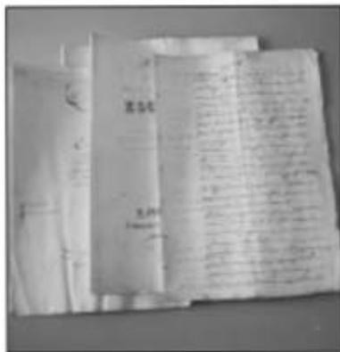
Documents de la donació Vilallonga.

Ingrés: febrer 1999. Donació feta per Esteve Vilallonga Perich