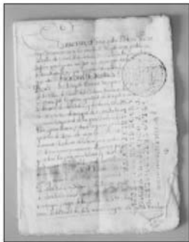
El document més antic que es conserva a l'Arxiu és aquest testament de l'any 1729

Escripcions de censos i censals, donacions, permutes, testaments,