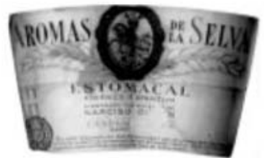
El licor més popular d'Anissats Duran.