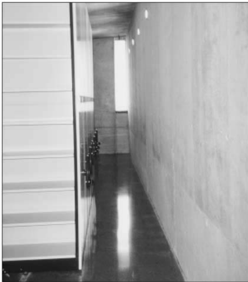
Dipòsit de l'arxiu del nou equipament.

gent es banyi nua a la bassa d'en Geronès i a la resclosa de Verneda. Aquest ban ofereix dues informacions ressenyables com a mínim: costums i llocs d'esbarjo que s'han perdut. Un altre apartat molt interessant és el de Correspondència que ocupa 16 metres lineals de prestatgeria i que es conserva a partir de l'any 1808. En aquest epistola-