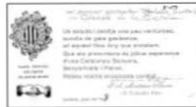
Correspondència de caràcter catalanista.

Mitjançant aquesta documentació coneixem les tasques que va emprendre aquest personatge cassanenc i la seva producció.