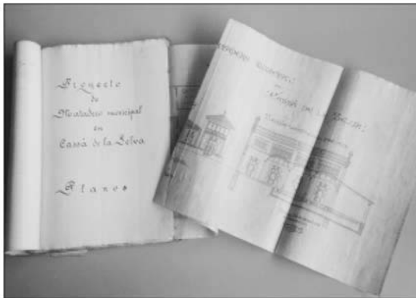
Expedient per al projecte de l'escorxador municipal.

L'Àrea d'Urbanisme i Obres és un altre dels grans apartats de l'Ajuntament, tant pel que fa al volum que ocupa com per la varietat de recerques que s'hi poden fer. Documents que formen part d'aquest grup són les sol·licituds de permisos d'obres per part de particulars, els projectes de construcció d'equipaments municipals, els projectes urbanístics i els planejaments generals. Coneixem així els projectes d'Eixample del poble, que coincideixen amb els moments de major activitat econòmica de la població, els projectes d'urbanització de carrers i la implantació de serveis tan importants com