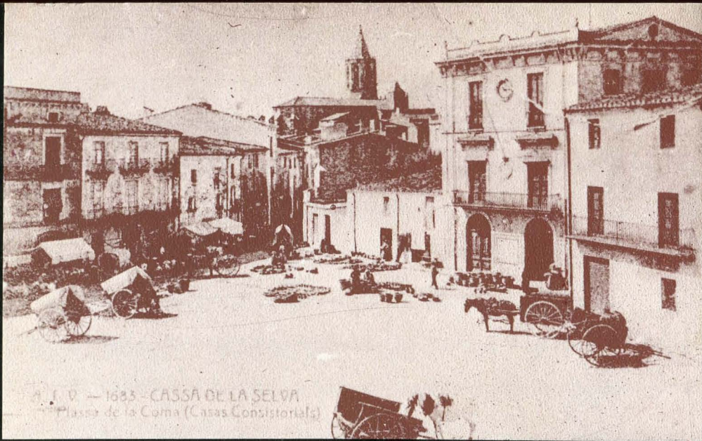
1683 - CASSÀ DE LA SELVA Plaza de la Coma (Casas Consistoriales)