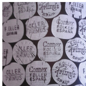
Taps al ple Oller (Fons Oller)

Comparativament, l'any 1928 Francisco Oller va vendre a la Xampanya 10 milions de taps, sobre una producció de 27 milions d'ampolles de xampany, que van representar gairebé el 40% de la producció mundial.