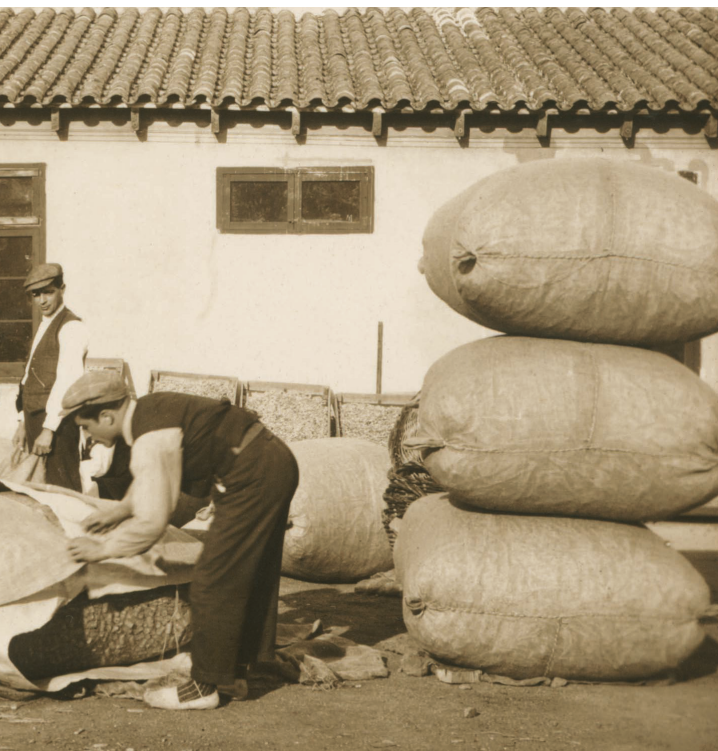
cap a França el 1919

i Monterrey de Mèxic); el deteriorament patrimonial per la bancarrota de la Banca Rivera. Tots aquests fets van provocar la fallida de l'empresa que va caure definitivament el 1912 amb la subhasta de la fàbrica de Cassà.