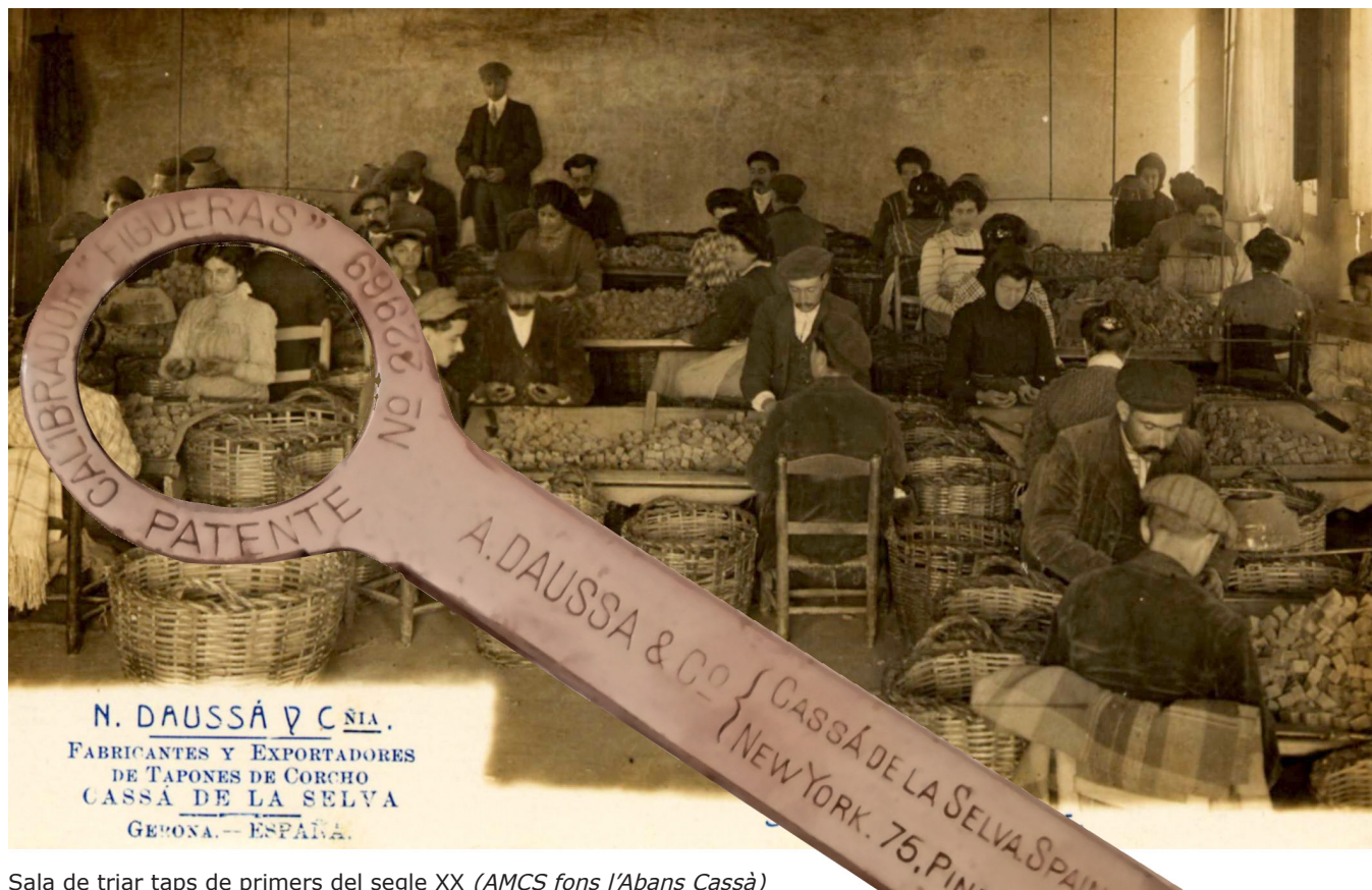
Sala de triar taps de primers del segle XX (AMCS fons l'Abans Cassà)

COORDINACIÓ: Arxiu Municipal de Cassà de la Selva