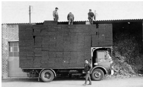
Fàbrica Germans Bernà

La paraula mascarins prové d'emascarats, ja que els treballadors en acabar la seva jornada arribaven a casa seva negres com el carbó. Durant tota la segona meitat del segle XX la panoràmica de Cassà vista des de la zona alta del Revellí, a l'altura de la carretera de Caldes, era molt diferent de la que podem veure avui. Un poble amb un campanar al centre envoltat per quatre columnes de fum: les xemeneies de les quatre empreses que fabricaven el suro negre (aglomerat per expansió). En la fabricació, el granulat de suro era sotmès dintre un autoclau a vapor d'aigua a 420 graus de temperatura i el vapor sobrant es llençava a l'aire mitjançant la xemeneia; en aquest procés es creaven unes volves de suro cremat en suspensió, que empastifaven tot el poble depenent del vent que bufava, amb les consegüents queixes de les dones que tenien roba estesa, que quedava tacada per aquest polsim negre.