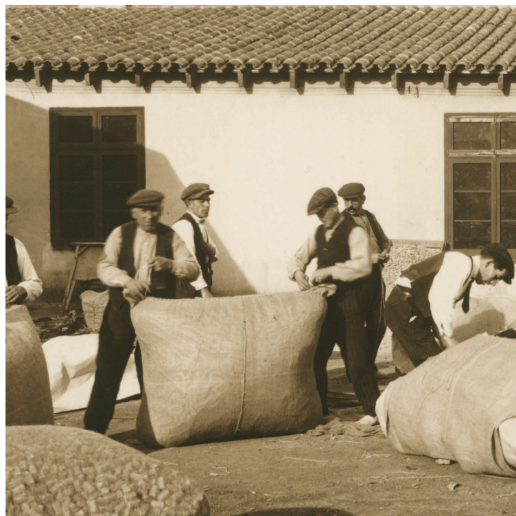
Empaquetant taps per enviar

es va instal·lar a San Juan de Puerto Rico i després d'algunes vicissituds va fundar una acadèmia per a l'educació dels joves porto-riquenys que més tard va vendre a una empresa americana. Aquesta venda és l'origen de la seva gran fortuna, que mai va invertir en el món surer. L'any 1890 es va retirar a Barcelona per viure de renda la resta de la seva vida. Al seu testament va deixar al poble de Cassà 50.000 pessetes, 25.000 a l'Ajuntament i 25.000 a l'església.