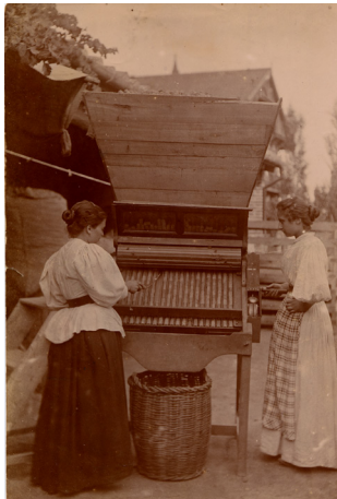
Comptant taps fa 100 anys