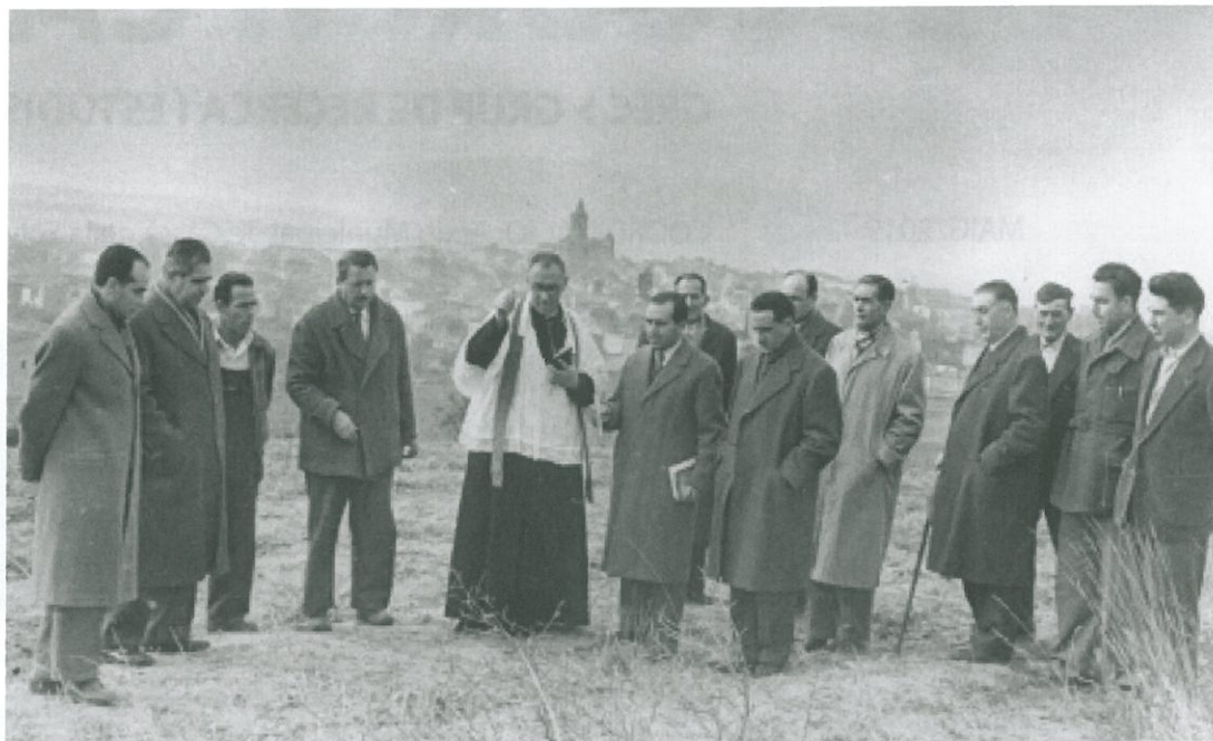
Benedicció del dipòsit d'aigua l'any 1957