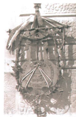
Pendó de la Tenora (AMCS Col·lecció Ajuntament)