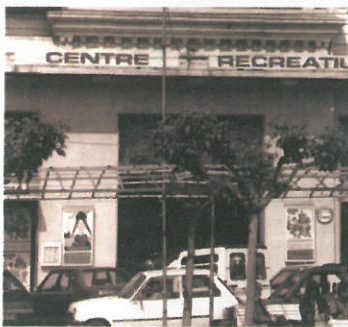
Les cartelleres del cinema