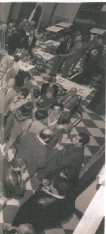
o X.Sureda (Arxiu X Romero)

deixar d'esmentar igualment la bona predisposició a col·laborar amb altres entitats del poble, la cessió dels locals a tothom que els necessitessin, i el patrocini d'equips propis com aquell del futbol d'empreses, i els de futbol sala. Una altra fita important i la més recent de totes ha estat l'acord a què s'arribà amb l'Ajuntament (aprovat en conveni pel Ple del 7 d'abril de 2005) de la remodelació total i la cessió del local del cinema per ser gestionat públicament per 50 anys, amb la qual cosa hom recupera definitivament un espai amb prou aforament, polivalent i cèntric, que ha solucionat diverses mancances municipals al respecte. Per la seva banda, el saló cafè, que de sempre han gestionat els conserges/arrendataris, ha complementat recentment l'oferta clàssica amb la de restaurant, que afegit a la generosa carpa de la Coma atorga a aquesta societat la possibilitat d'una completa línia d'activitats lúdiques.