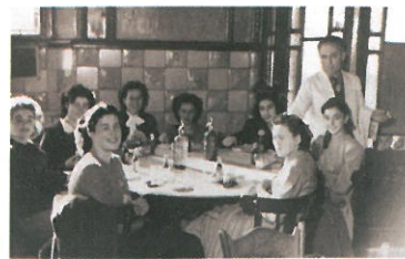
Al fons es veu la rajola massoniana