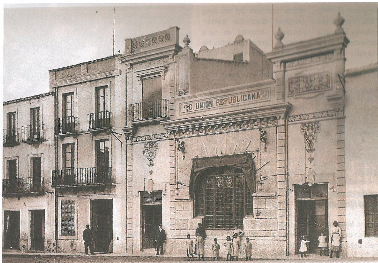
Postal anys 20 del s. XX. Centre Unió Republicana. Autor L. Roisin (Procedència arxiu X. Romero)

COORDINACIÓ: Arxiu Municipal de Cassà de la Selva