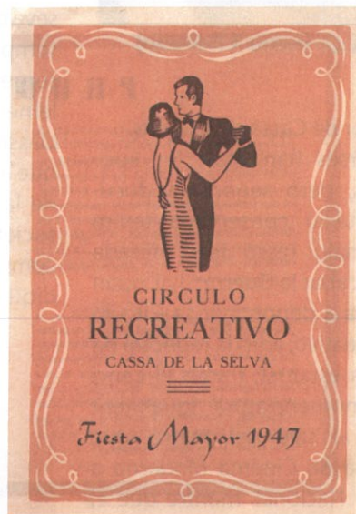
Programa de la Festa Major del 1947

La Festa Major del Centre Recreatiu es convertí durant la segona part del segle passat en un gran esdeveniment, dedicat als seus socis, i que col·laboren alhora al major esplendor de la setmana gran cassanenca. Unit a la façana de l'immoble s'hi aixecava un envelat força digne i ben acollidor, per on passarien les millors formacions musicals -durant molts anys La Principal de la Bisbal-, així com espectacles diversos, fins i tot desfilades de moda. Una repassada als programes d'impremta editats per l'entitat, amb tal motiu, ens pot donar a conèixer aquesta reeixida activitat lúdica.