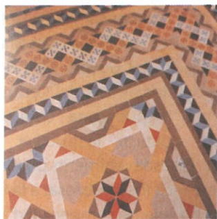
Vista del mosaic

Encara molts recordaran el magnífic mosaic fet de petites peces que decorava el terra del cafè. Aquest ric element, desaparegut l'any .... era un vestigi de la primera època i procedia de l'empresa Mosaics Nolla de València. Va ser creat l'any 1892 i es tractava d'un complex dibuix de petites peces de gres monocrom encaixades pacientment a l'estil d'un paviment grecoromà. En el cas de Cassà formava uns requadres amb estrelles envoltats d'una gran sanefa. N'hi ha un exemplar, creiem que idèntic, al palau Novella del Garraf..