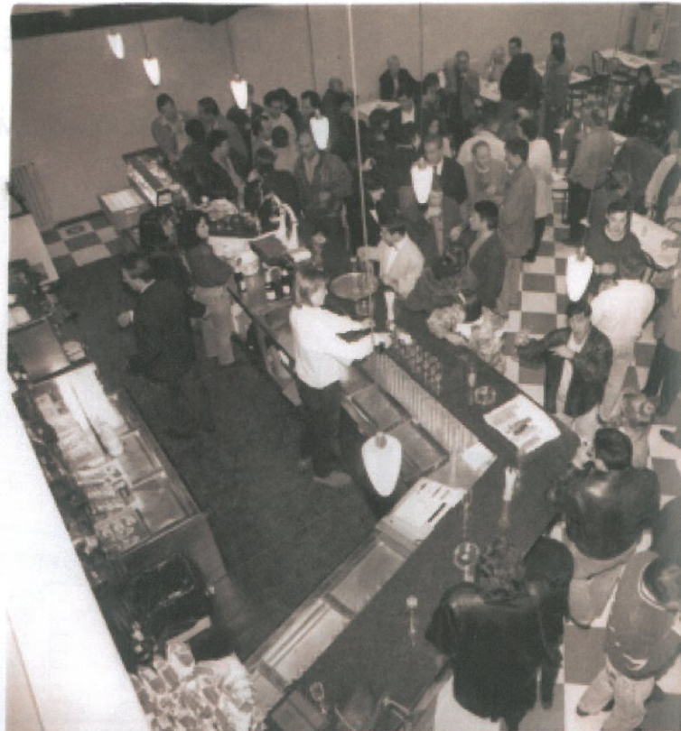
Inauguració de la remodelació del saló cafè l'any 1994. Foto

En el cas del Centre cassanenc, cal recordar que la magnífica biblioteca que atresorava acabava desapareixent durant la