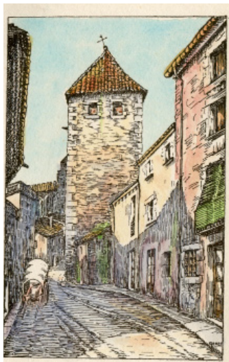
Dibuix de la torre Selvana