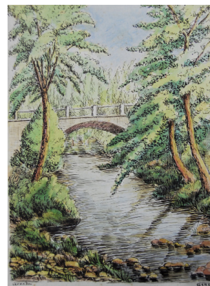
Aquarel·la del pont de Verneda (Procedència: Montserrat Gener)

l'extensa obra realitzada, complementada pels olis i dibuixos acolorits a la tinta i a l'aquarel·la. Els temes predominants són els paisatges dels voltants de Cassà, els de Besanó, per la seva relació familiar, ja que la seva dona era d'aquella població, també els carrers i campanars del barri