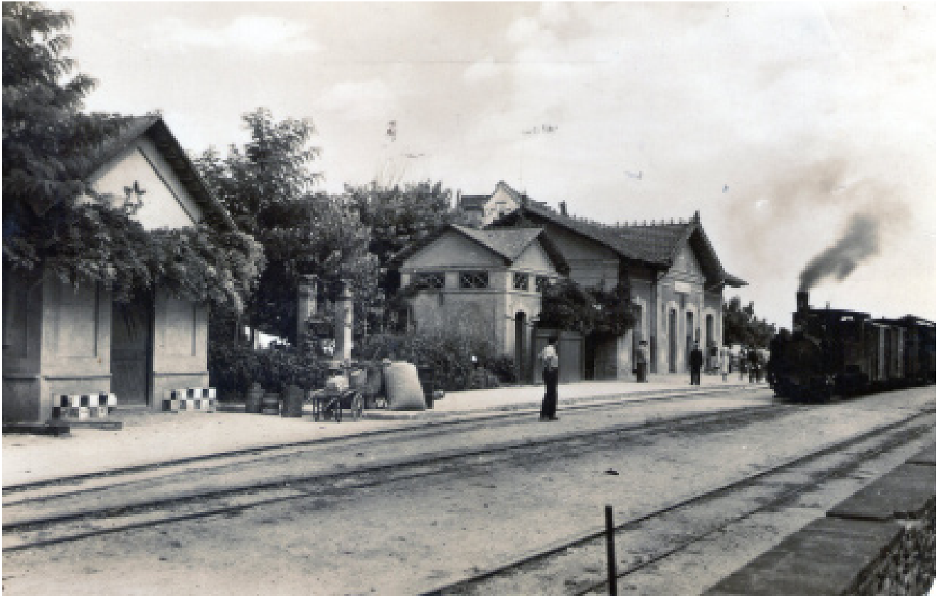
Vista general de l'estació. Viatgers esperant l'arribada del "carrilet"

COORDINACIÓ: Arxiu Municipal de Cassà de la Selva