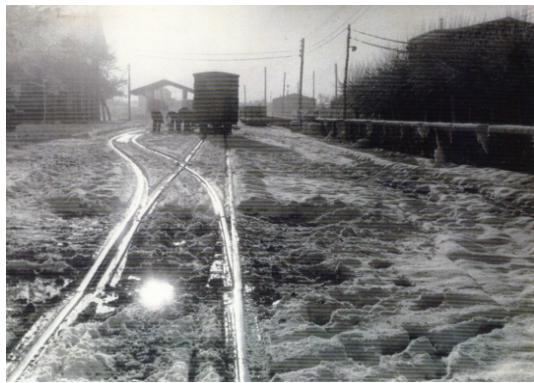
Nevada del 1962

Una de les vicissituds amb què es trobaven sovint en aquell temps els trens petits eren les inclemències meteorològiques, i especialment les nevades, la qual cosa obligava a paraitzar el trànsit i la brigada d'obres del carrilet tenia moltíssima feina extra.