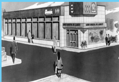
Maqueta del 1972