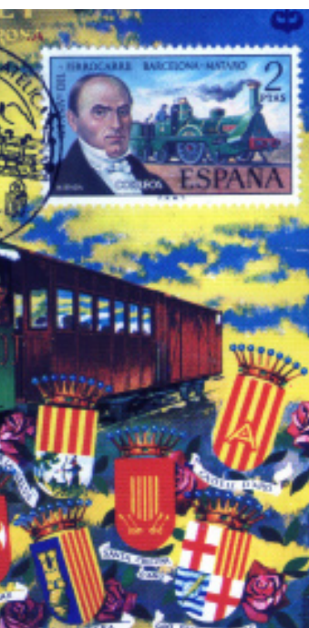
La reté homenatge al "carrilet" a més dels de la Diputació

m per salvar el riu Verneda, al km 16,326, i el baixador d'Esclet, al km 16,480.