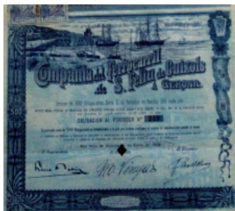
Una acció del tren

El capital social inicial va ser d'1.536.100 pessetes -1-9-1890-, dividit en 15.361 accions de 100 pessetes cadascuna, i títols que aplegaven 1, 5 i 25 accions. Aquest capital seria cobert gairebé en la seva totalitat pels veïns guixolencs, aleshores amb un cens d'uns 7.000, per la qual cosa hom pot considerar com a una propietat ben repartida, popular i meritòria, un