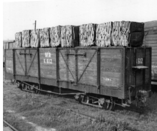
Mostra del transport ferroviari

Sens dubte que el principal motiu per a la creació de la línia ferroviària de Sant Feliu a Girona fou poder donar sortida a les manufactures sureres, talment com succeï uns anys abans amb el tren de Palamós-Flaçà-Girona.