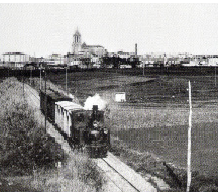
El tren surt de Cassà en direcció a Sant Feliu

Km 13,412 i que, prèviament i venint de Girona en primer