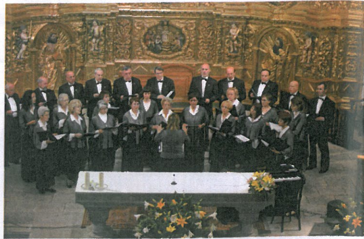
La Coral Bell Resso en un concert de Nadal