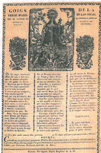
Els goigs de la Mare de Déu de les Sogues