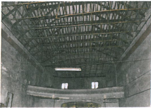
Antic local de l'Orfeó Catalunya el 2017