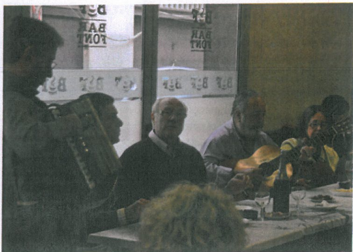
Els Trefins en un concert al Bar Font