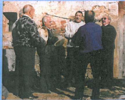
La Colla dels Tranquils a la festa de Sant Vicenç als anys 90 (Xavier Albertí)

L'any 1980 quan La Colla recupera la celebració de la Festa d'Esclat es revitalitza la Colla dels Tranquils que canten els goigs de St. Vicenç.