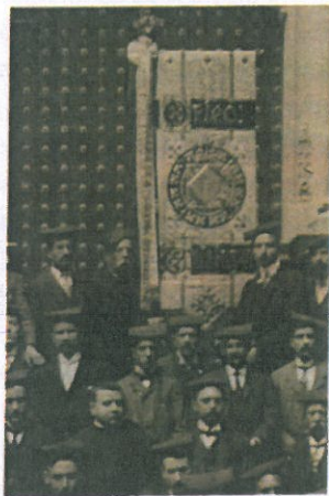
L'Orfeó Catalunya a Montserrat amb l'estendard, el 1905 (AMCS - Col·l M a Ll. Dausà)

On sí que hi intervingué l'insigne arquitecte va ser en elements decoratius al local de l'entitat que malauradament ha desaparegut, igual com passà amb el "Centro"