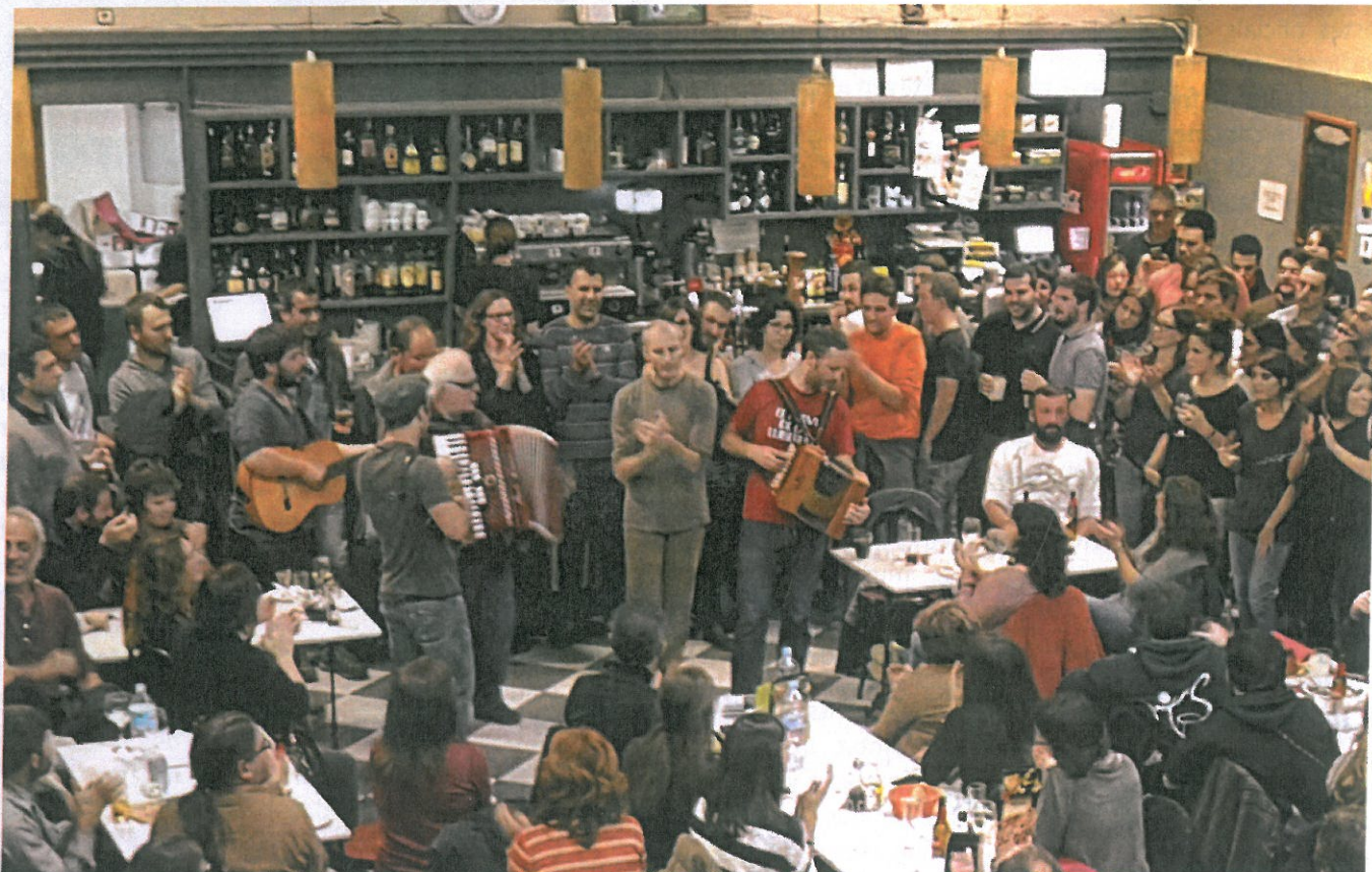
Càntut 2016, al Centre Recreatiu

COORDINACIÓ: Arxiu Municipal de Cassà de la Selva