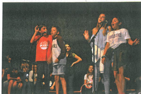
Alumnes de l'Escola Puig d'Arques a la celebració dels 10 anys de glosa (Gemma Pla)

La llavor està plantada. Ara, cal regar-la entre tots.