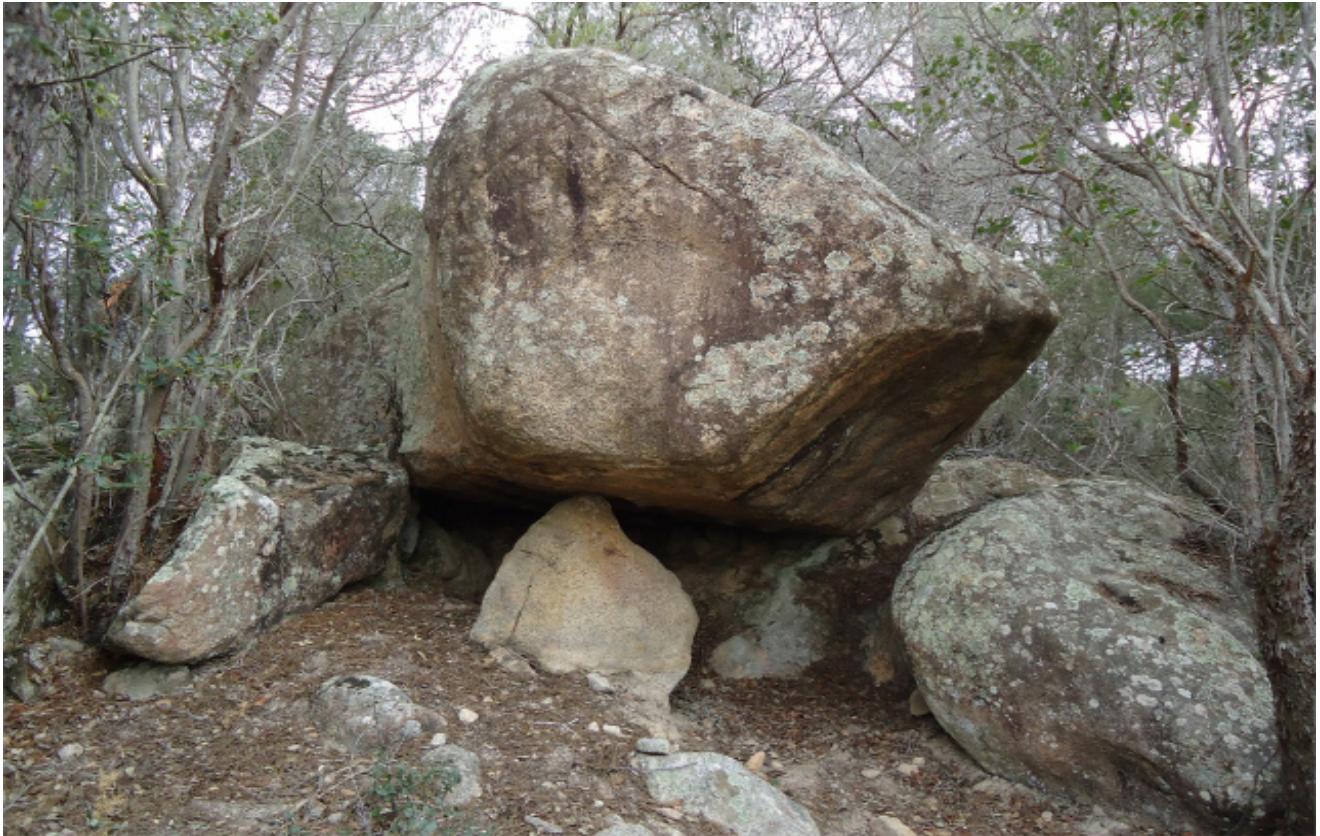
Roca de les Tres Rases

COORDINACIÓ: Arxiu Municipal de Cassà de la Selva