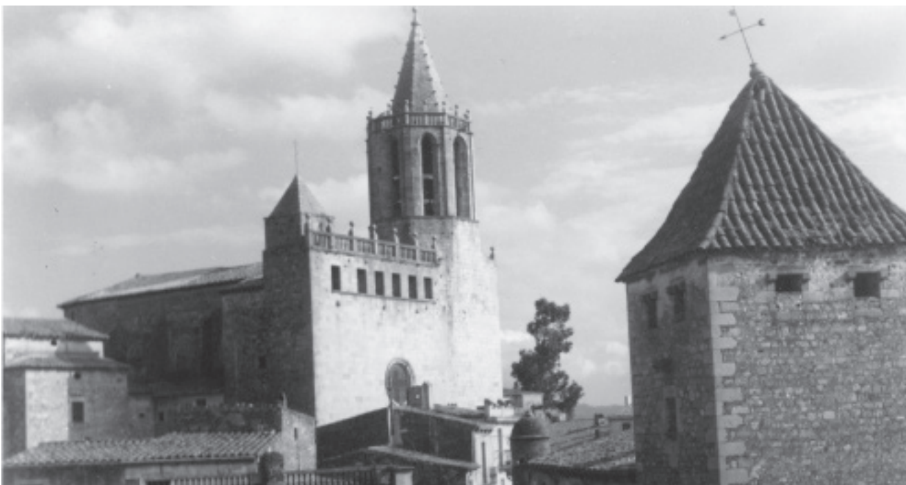
Vista de l'església de Cassà i la Torre Salvana, a la dècada de 1950

ABRIL 2015 3 COORDINACIÓ: Arxiu Municipal de Cassà de la Selva