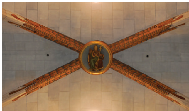
(Autor: Xavier Albertí)

Durant la restauració de l'església l'any 2005, van sortir a la llum unes pintures de dracs serps a la volta de la nau central. Aquest fet va ser una sorpresa per a molta gent, ja que gairebé no es veien. No sabem amb exactitud quan van ser pintats. Tenim constància que l'any 1787 "se ha emblanquinat la Iglesia, renovant les pintures y donat color als arcs" a càrrec d'un emblanquinador i un pintor italià, cosa que hi podria tenir a veure. El seu significat també és confús. Podria tractar-se d'un símbol de dominació de les forces salvatges o ser utilitzats com a guardians dels trossos. Encara queda molt per conèixer sobre els dracs-serps de la nostra església.