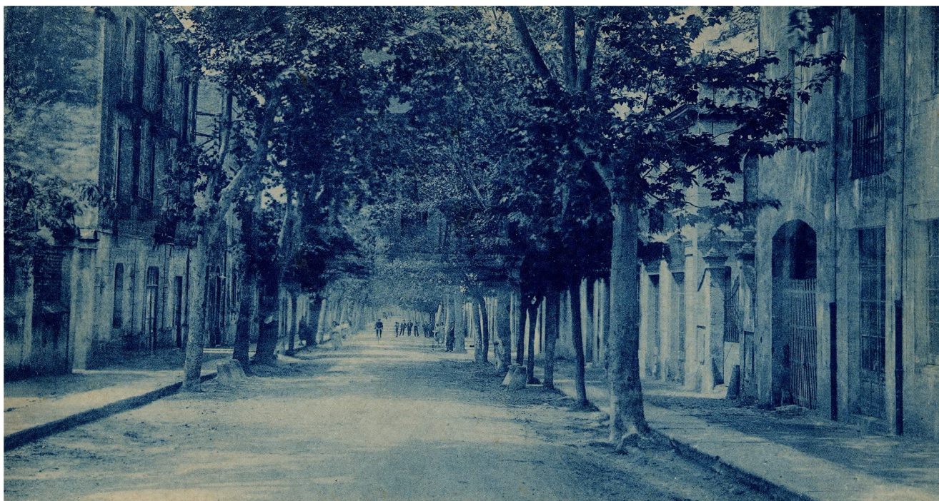
La carretera Provincial a principis del segle passat. (AMCS, col·l. Joan Bernà. Autor : Thomas)

DESEMBRE 2014 2 COORDINACIÓ: Arxiu Municipal de Cassà de la Selva